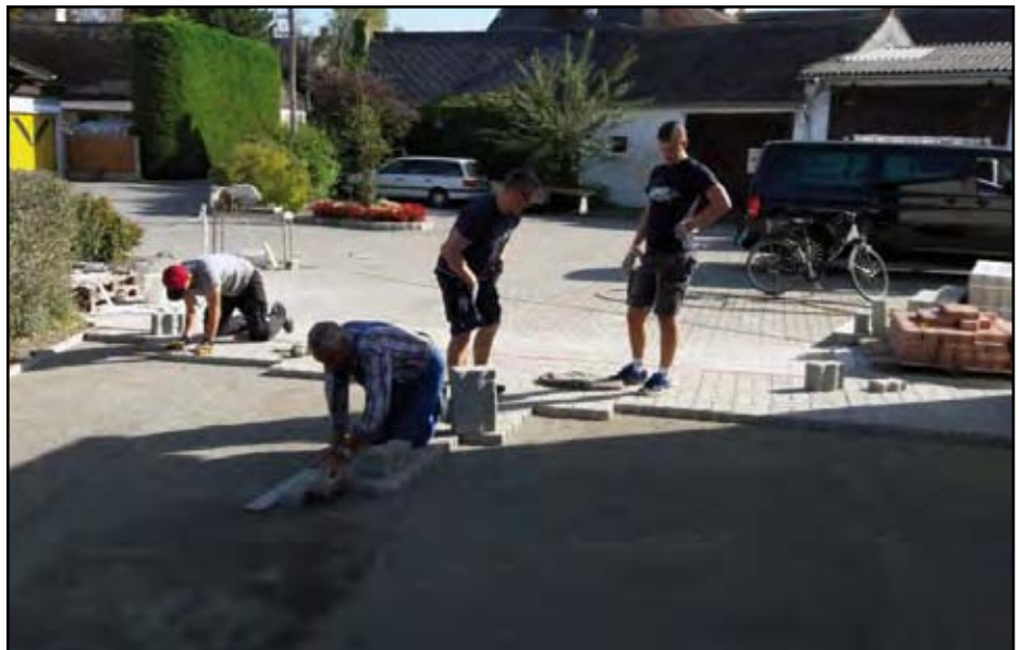
Viele Hände - ein schnelles Ende.