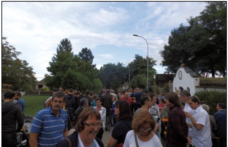
Der Besucheransturm war vor allem am Sonntag enorm.