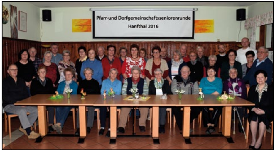
Die Senioren freuen sich auf zahlreichen Besuch.