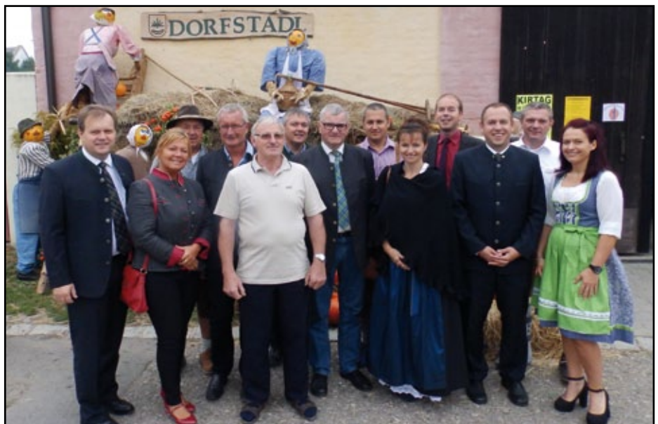
Auch zahlreiche "prominente" Gäste konnten begrüßt werden.