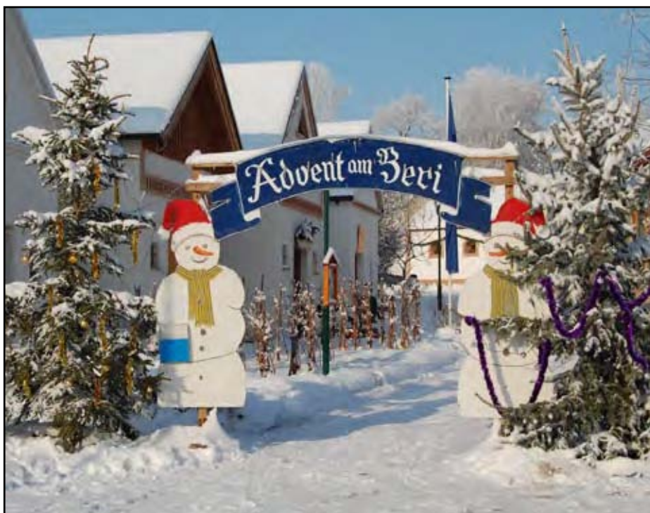
Der Adventeingang mit Schneemännern erwartet die Besucher.

Kunsth Handwerk, Bastelarbeiten und lebendes Handwerk bereichern den Adventmarkt. Beim Altwaren- und Antiquitätenflohmarkt können besonders ausgefallene Raritäten erworben werden.