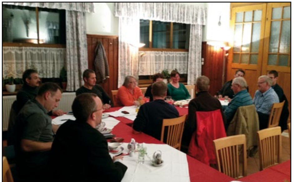
Rege Diskussion beim Vereinstreff.

In der Oktobersitzung stand vor allem die Organisation des Advent am Beri am Programm. Die einzelnen Stationen wurden besprochen und die Arbeitseinsätze koordiniert. Alle Vereine, welche bisher bei der Adventveranstaltung mitgemacht haben, werden auch dieses Jahr wieder mit dabei sein. Es kam zu einer intensiven Diskussion bezüglich der weiteren Abhaltung dieser Veranstaltung. Die Dorfgemeinschaft Hanfthal wird die Adventveranstaltung in diesem Jahr das letzte Mal durchführen. Es wurde vereinbart, dass bis zum nächsten Vereinstreff im Frühjahr (voraussichtlich März 2017) eine Entscheidung getroffen wird, wie in Zukunft diese Veranstaltung abgehalten werden kann.