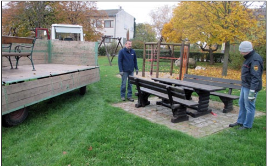
Alle Sitzgarnituren und Bänke werden über den Winter im Dorfstadl gelagert.