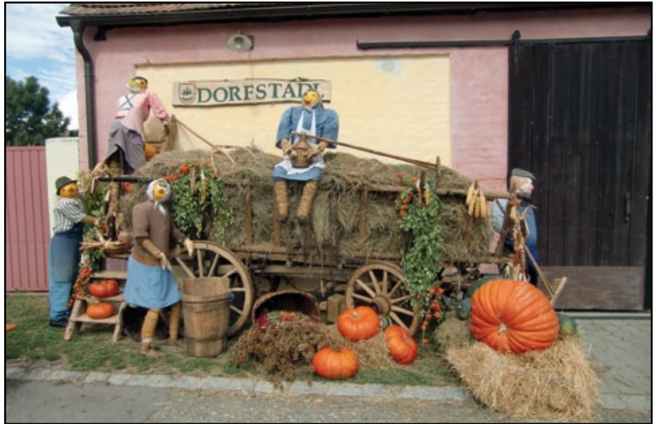
Die herrliche Dekoration lädt die Gäste zum Besuch ein.

Finanziell war es das zweitbeste Stürmische Bluzafest, somit ist die Finanzierung von Projekten in und für Hanfthal für die nächste Zeit gesichert. Der Standort im Dorfstadl und das Festgelände in der Kellergasse haben sich bewährt. Das Fest hat sich überregional positioniert und ist weit über die Bezirksgrenzen bekannt.