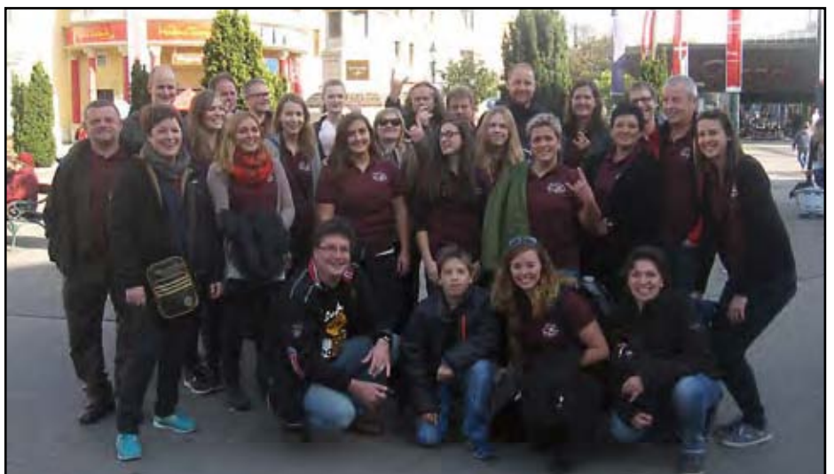
Ausflug in den Wiener Prater samt Besuch im "Schweizer Haus".

Programm. Dieses Mal ging es mit der Bahn in den Wiener Prater, wo zuerst die verschiedensten Attraktionen getestet wurden. Anschließend ging es ins Schweizerhaus, wo die bereits tra-