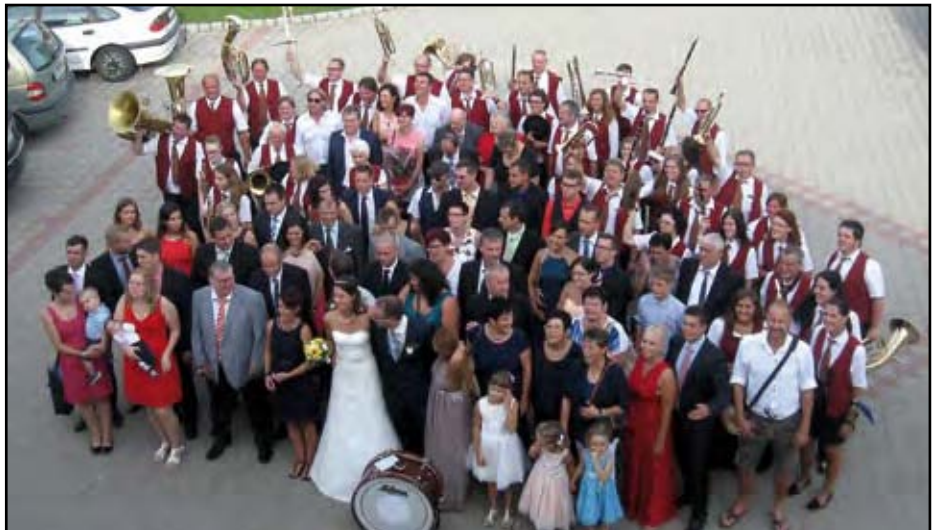
Der Musikverein hatte im Jahr 2016 einige Hochzeiten zu spielen.