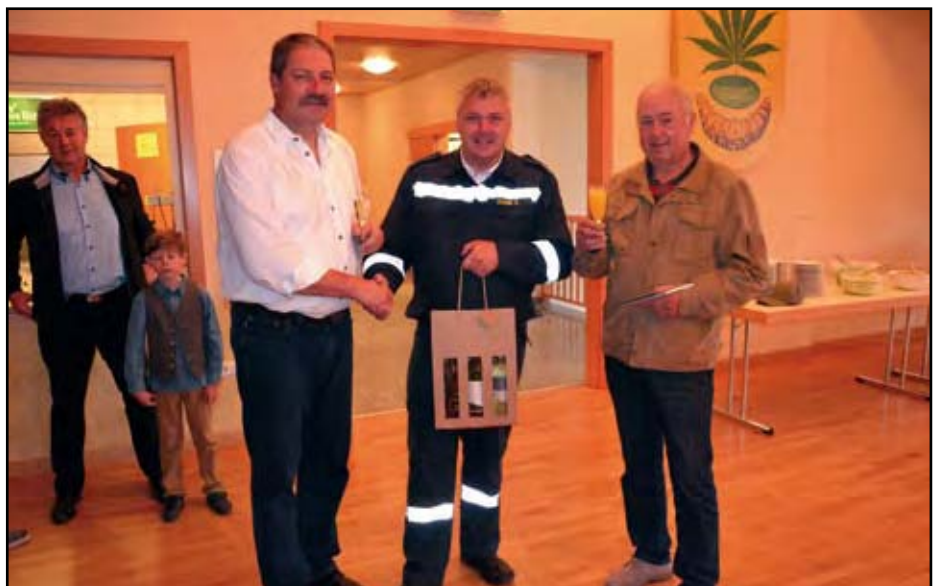
Feuerwehr und Dorfgemeinschaft gratulieren zum Geburtstag.

Hanfthal sorgt er gemeinsam mit den Landwirten für die Instandhaltung der Gräben und Drainagen.