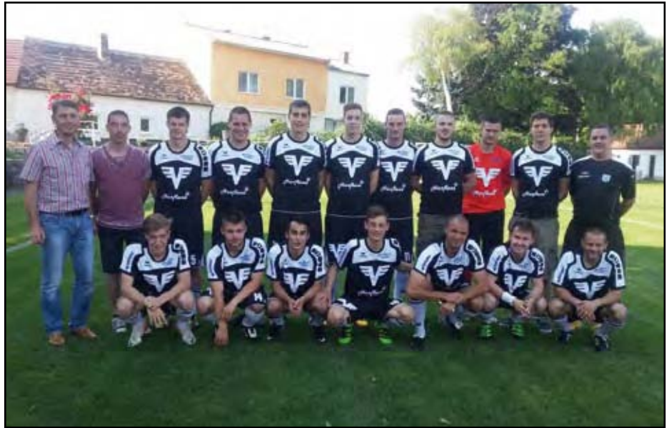
Die erfolgreiche Kampfmannschaft des UFC Hanfthal.